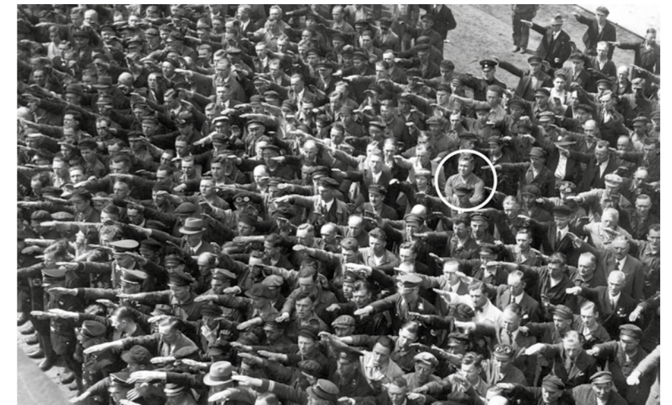
August Landmesser, Hambourg, 1936